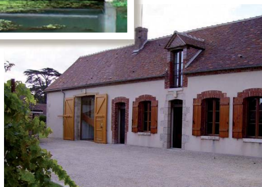
Le gîte de Griselles (1999/2000)