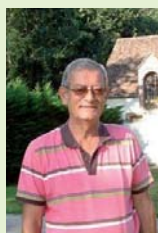
PHILIPPE ARBEL Maire de Chevry

Commission Communication, relations publiques, liaison avec les communes