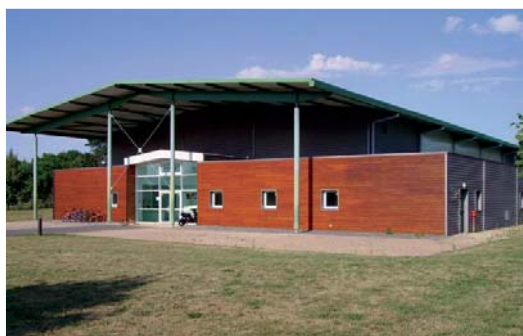
La construction du gymnase de Dordives (2002/2003)

Parmi les nombreuses réalisations de la CC4V on peut citer quelques exemples :