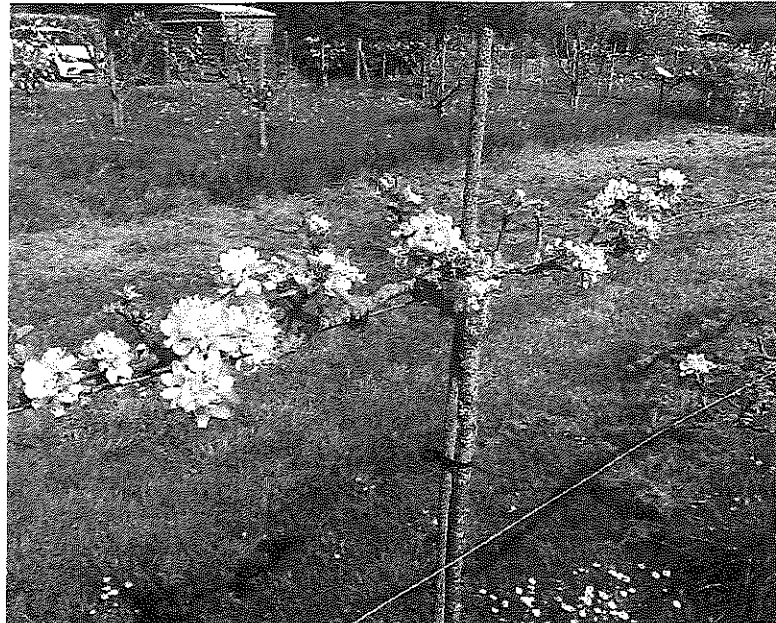
arbres grandissent et beaucoup d'entre eux ont fructifié en 2018 (photo